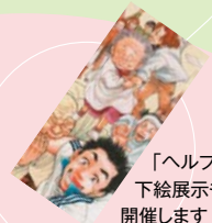
「ヘルプマン」 下絵展示も 開催します

お問い合わせ：文京区介護保険課 03-5803-1383 文京区社会福祉協議会 03-3812-3040